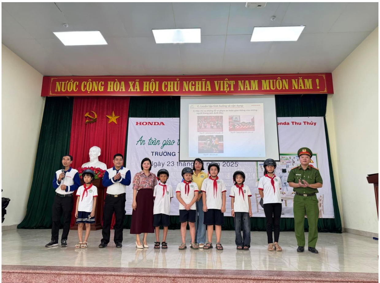
Các em học sinh thực hành kiểm tra và cách đội mũ bảo hiểm.