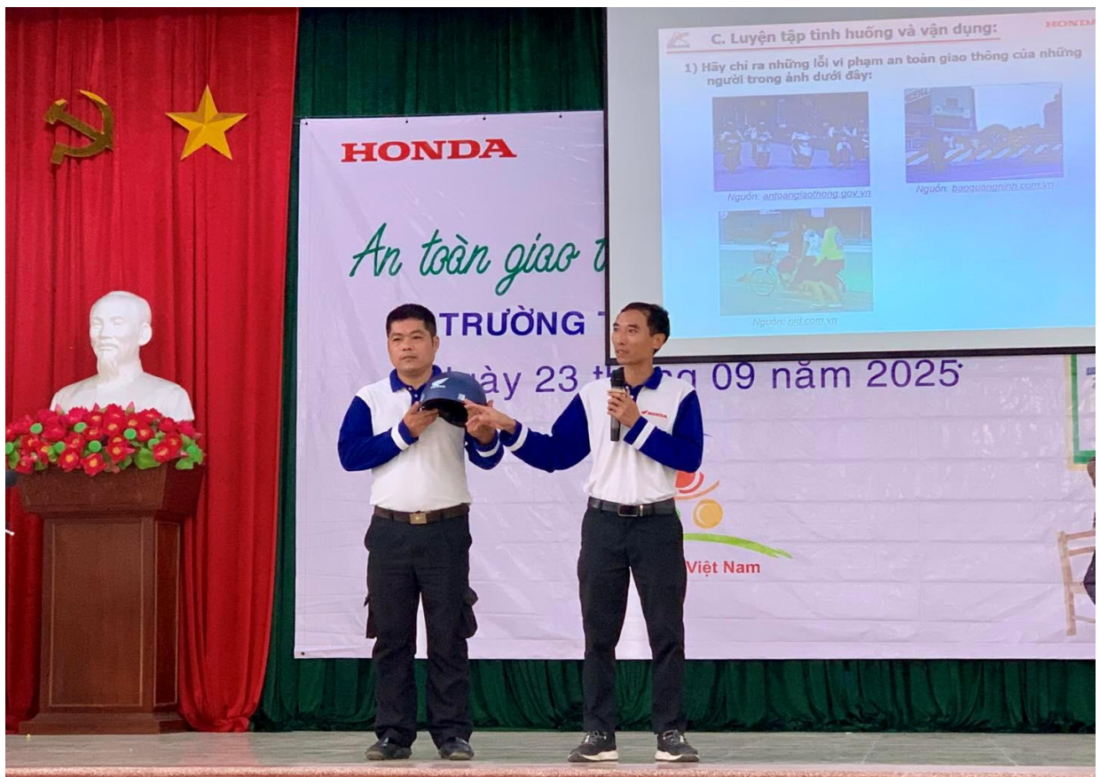
Các chú công an hướng dẫn cách kiểm tra mũ bảo hiểm