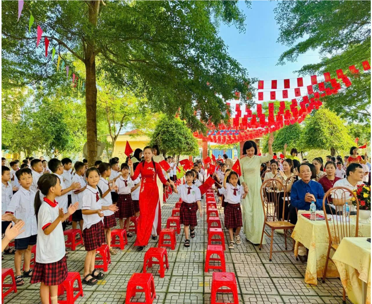
Cô hiệu nhà trường ân cần đón các em học sinh lớp 1