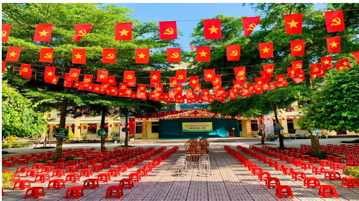
Công tác chuẩn bị cho ngày khai giảng

Buổi lễ khai giảng đã diễn ra trong không khí trang trọng, ấm áp và đầy cảm xúc, để lại nhiều ấn tượng sâu sắc trong lòng thầy cô, học sinh và phụ huynh, mở đầu một năm học mới với quyết tâm và khí thế mới.