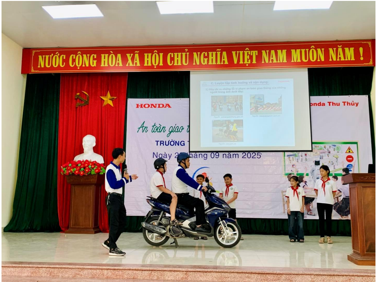
Các chú công an hướng dẫn các em học sinh cách ngồi trên xe máy an toàn