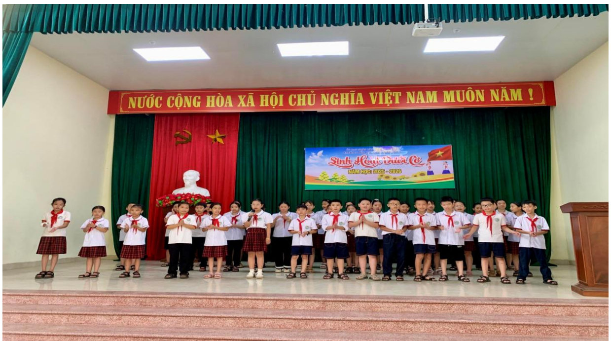
Tiết mục đồng diễn của các em học sinh lớp 5

Giây phút tự hào khi ôn lại truyền thống hơn 10 năm xây dựng và phát triển của mái trường Trần Quang Khải.