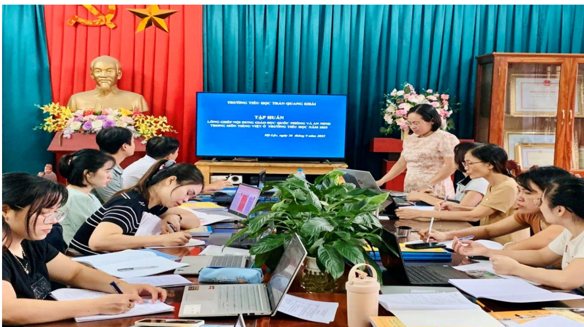
Cán bộ giáo viên tham gia buổi tập huấn QPAN

Tháng 9 khép lại, để lại bao kỷ niệm đẹp: tiếng trống khai trường vang vọng, những tiết học đầu tiên tràn đầy hứng khởi. Chuỗi hoạt động ý nghĩa trong tháng