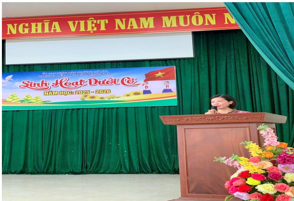
Cô Hiệu trưởng dẫn dò các em học sinh

Lời phát biểu, chỉ đạo và động viên sâu sắc từ Ban giám hiệu và cô Tổng phụ trách Đội, tiếp thêm niềm tin và động lực cho thầy trò toàn trường.