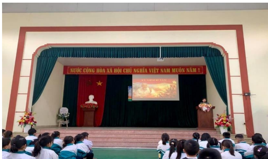
Tiết sinh hoạt dưới cờ tại trường Tiểu học Trần Quang Khải