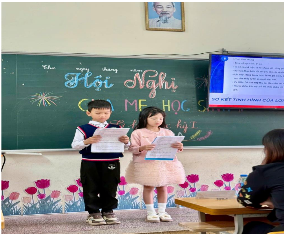
Hội nghị cha mẹ học sinh tại lớp 2A